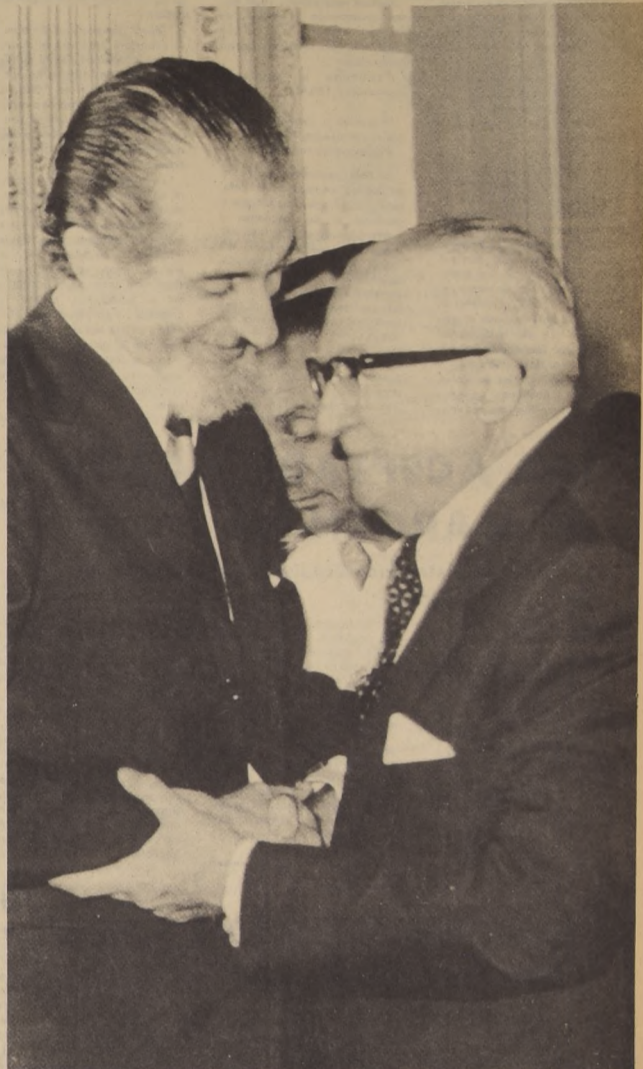
Alejandro Ríos Valdivia y José Tohá, dos generaciones pero una sola voluntad de servir al pueblo, se saludan cariñosamente simbolizando la respuesta del Gobierno y de la Unidad Popular a la esteril guerrilla parlamentaria, que ha terminado por cansar a las masas que, en forma espontánea, rodearon el edificio del Parlamento, convirtiéndose en el más decisivo personaje de los acontecimientos del jueves en la noche.