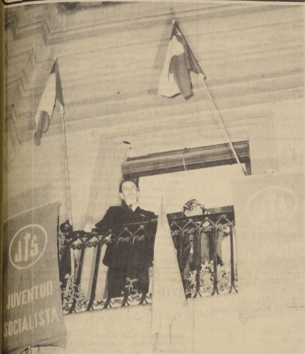
EL PRESIDENTE ALLENDE y SU MINISTRO JOSE TOHA reciben la cariñosa ovación de los miles de trabajadores que, después de haber permanecido en guardia 14 horas frente al Parlamento, marcharon hacia el Palacio de la Moneda

● Allende: "No habrá guerra fratricida" ● Tohá: "Deseo seguir sirviendo a la gran causa del socialismo, de la revolución y de la Patria" ● Cientos de trabajadores aguardaron 14 horas fallo de acusación y luego, en orden, marcharon hacia la Moneda para escuchar a Allende y Tohá