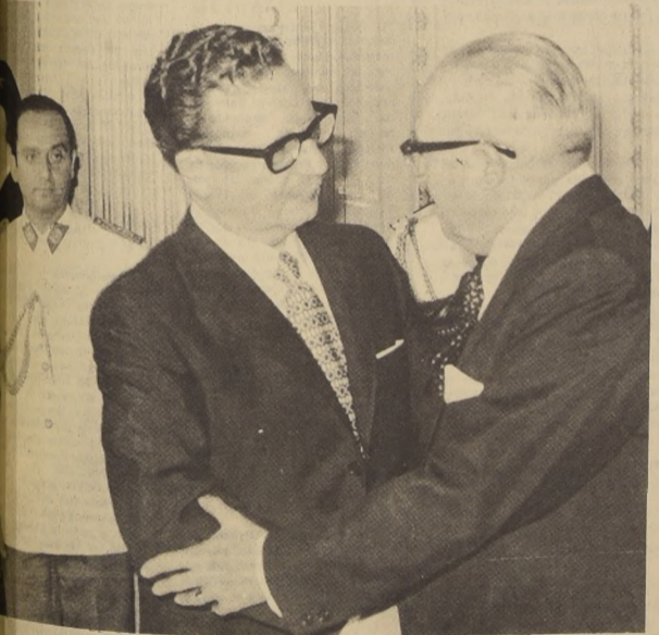
El Jefe del Estado felicita a Alejandro Ríos Valdivia, luego de leerse el decreto que lo designa Ministro del Interior

"más que satisfactorio, emocionante" porque recibía una vez más una prueba de confianza del Presidente Allende. "Es por eso que el hecho de contar en este momento con esa confianza me mueve a la reflexión y me señala la obligación de redoblar los esfuerzos para servir mejor al Gobierno y al país."