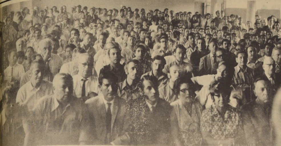
UNA PARTE DE LA ASAMBLEA... De todas partes y de todas las edades llegaron los hinchas. En ellos está la fuerza que asegura una vida de éxitos y facilita mirar de frente al futuro.