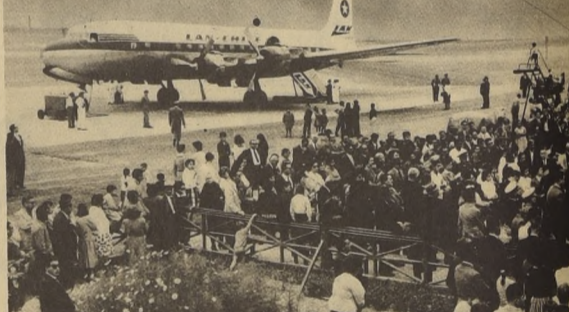
EL AEROPUERTO CAVANCHA será reemplazado en breve por la moderna pista Chucumata, ya que la ubicación del primero, en pleno corazón de la ciudad de Liquique, presenta numerosos problemas. La nueva pista situada a 25 kilómetros al sur del pueblo, estará lista a mediados del próximo mes.

El edificio de pasajeros está en etapa de proyecto, como también la torre de control y el edificio de salvataje. En conjunto, estos edificios tendrán una superficie de 1.500 metros cuadrados y tendrán capacidad para atender simultáneamente a pasajeros de tres modernos aviones a reacción.