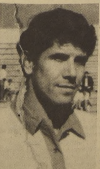
URUGUAY GRAFIGNA, la peor amenaza para el meta Tasma de Vasas.

El triangular será entonces una excelente oportunidad de ver a San Felipe, futuro representante nacional en la Libertadores y, además de ver la actuación de los excelentes futbolistas húngaros, entre los que destacan el tradicional Farkas, centrocampista que ya demostró su capacidad frente a Deportes Concepción, al Zaguero Varadi y al meta Tamás, de excelente actuación en su primer partido.