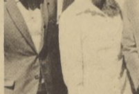
ESTE GRUPO de trabajadores de la Coordinación Regional de Educación de Coquimbo y Atacama, está muy contento, porque ellos y otros compañeros podrán perfeccionarse debido a que la U. del Norte dictará diversos cursos

De esta forma, la sede Coquimbo de la Universidad del Norte se suma a la campaña de extender la educación a todos