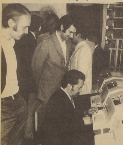
UNOS CUANTOS telexes y el télex transmite un completo mensaje. A través de un sistema instalado en la mayoría de las industrias textiles estatizadas, la CORFO coordinará las labores de producción.

Este nuevo sistema de comunicación, que fue instalado por ENTEL y Correos de Chile, será atendido por personal chileno especializado y de ser óptimos los resultados, esta red se ampliará, conectando a todas las filiales e industrias a lo largo del país.