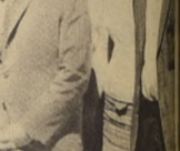
ESTE GRUPO de trabajadores de la Coordinación Regional de Educación de Coquimbo y Atacama, está muy contento, porque ellos y otros compañeros podrán perfeccionarse debido a que la U. del Norte dictará diversos cursos

Las delegaciones expresaron posterioridad una declaración de falcencia de dichos fondos municipales, que la Nación obligó a adoptar medidas en favor de estas comunas, y para ello una delegación viajará luego a la capital.