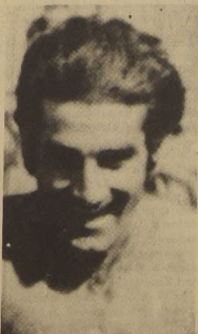
BEIRUTH discutido y todo, estará presente en el triangular.