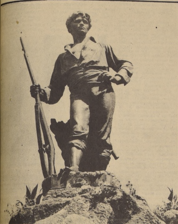
MONUMENTO AL "ROTO CHILENO", obra del escultor Virgilio Arias, silueta de hierro y que simboliza al valiente hombre de las gestas chilenas que escribió las páginas más brillantes de nuestra historia. Hoy, 20 de enero, se recuerda aquel mismo día de 1839, fecha de la batalla de Yungay que culminó la campaña contra la Confederación Perú-Boliviana. En