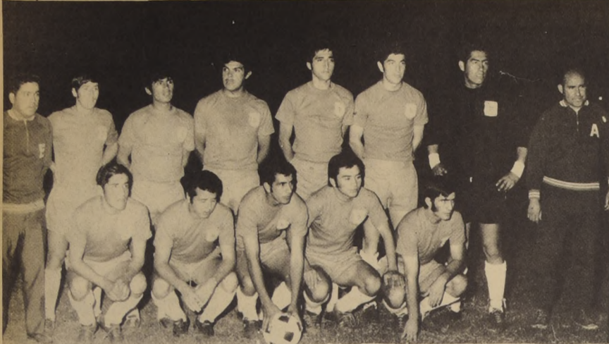
SELECCION DE MULCHEN: QUE CONSIGUIÓ SU PRIMER TRIUNFO DEL TORNEO AL GOLEAR A PUNTA ARENAS POR 5 TANTOS CONTRA 1. Los dos equipos sureños de la competencia son los de rendimiento más bajo.