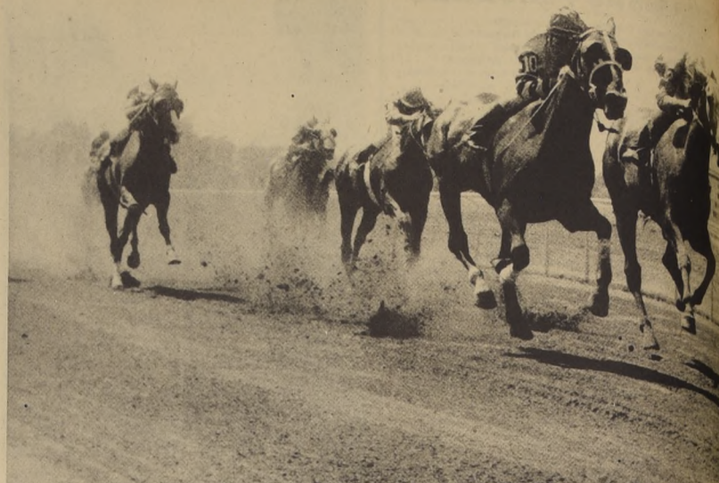
CARLOTITA supera con claridad a Enhuinchada en una prueba de 950 metros.

La combinación ganadora fue VIEL AMOUR EXACTO TAPALAPA Se acertaron 333 vales Cada uno cobró E° 755,90. El dividendo a segundo con Lord Soto fue acertado con 168 vales Cada vale cobró E° 373,60