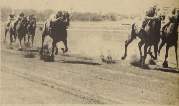
TUSRELLA gana la prueba inicial del programa palmeño. Buen punto para la pupila de Nereida.

Por su parte Tiroleso con Carlos Jorquera cubrió 600 metros en 37" 2/5 y repitió esa distancia en 36" 1/5. También aprontó Discipulo con Guillermo Pinto. Puso 1,04 para los 1.000 metros con 13" 2/5 para los últimos 200 metros. Este ejemplo será dirigido en El Derby por Sergio Azócar.