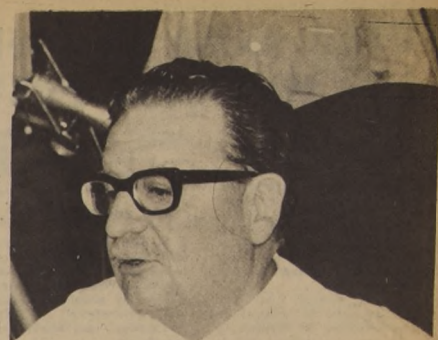
La ampliación de la base política del Gobierno con aquellos partidos que comparten el programa de la Unidad Popular, su estrategia y su táctica, anunció el Presidente de la República en su conferencia de prensa, ofrecida a los periodistas del sector Moneda. El jefe del Estado dijo también que el Tribunal Constitucional había rechazado prácticamente todos los artículos de la Ley de Presupuestos despatchados inconstitucionalmente por el Congreso.

factores que han influido, pero a grandes líneas, nadie puede estimar que este es un gran desastre. Si proyectáramos la misma votación en el campo nacional que no puede ser, porque estas provincias son adversas a nosotros) la disminución de la votación sería de un 2,5 por ciento.