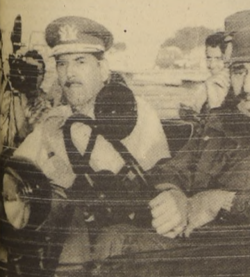
LA HABANA — La delegación militar chilena, encabezada por el general Carlos Araya Castro, aparece junto al Primer Ministro de Cuba, comandante Fidel Castro, durante las recientes maniobras realizadas en Pinar del Río.

La tercera Central Atómica, recordó se instalará en Bahía Blanca