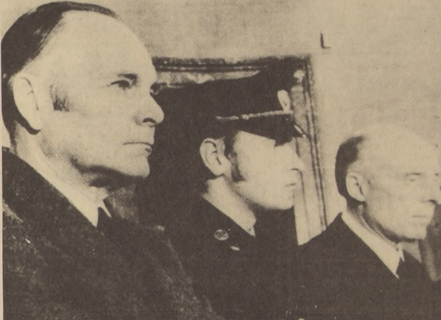
VIENA (Austria) — Los arquitectos austriacos, Walter Dejaco, izquierda, y Fritz Ertl, culpables de haber elaborado los planos que permitieron la construcción de los Campos de Concentración de Auschwitz, aparecen en los tribunales de Crimenes de Guerra, que los juzga. Tres millones de judíos murieron en esos campos de concentración.