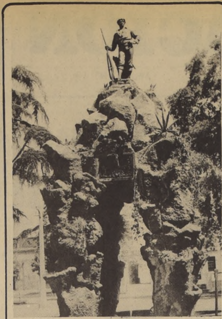
FRENTE AL MONUMENTO al Roto Chileno, ubicado en la Plaza Yungay, el Ejército chileno conmemora hoy el 132º aniversario de esa batalla que dio más gloria a nuestra Patria.