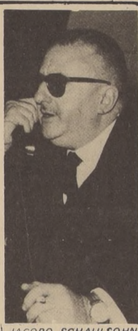
JACOBO SCHAUISOHN, ex Presidente de la Cámara de Diputados, profesor de Derecho Constitucional y miembro del Tribunal Constitucional.

Motivo de comentarios en todos los círculos ha sido la actitud de los diarios y radios de oposición, que han pretendido ignorar el fallo del Tribunal Constitucional, produciendo así desinformación en sus lectores y negándose a comentar los conceptos jurídicos de uno de los documentos más extensos y definitivos que se hayan conocido en toda la historia de esta especie de resoluciones.