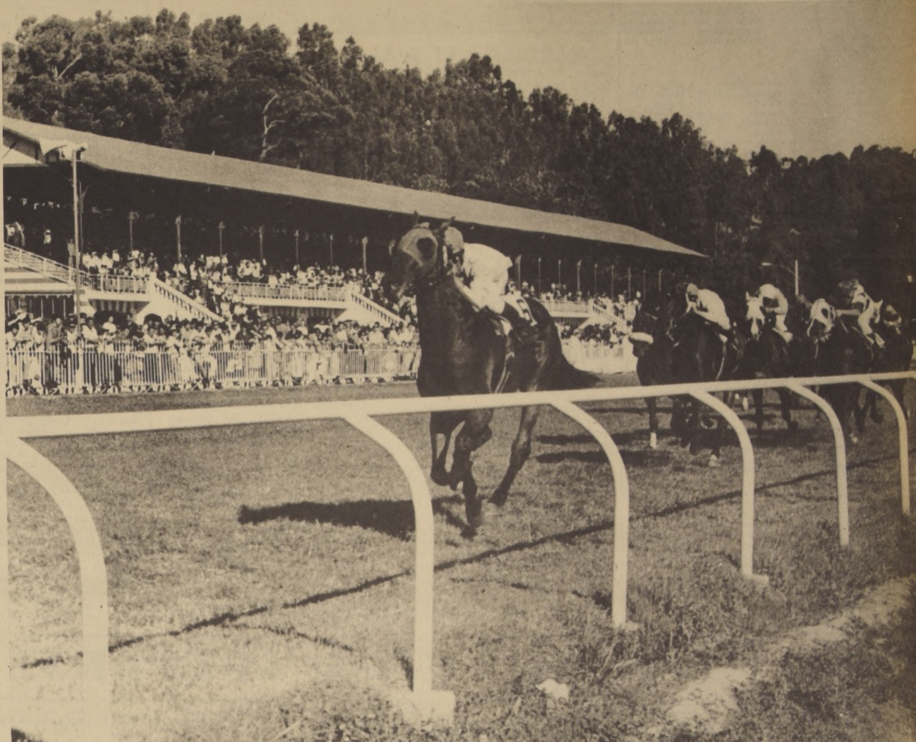
EL VAI PARAISO SPORTING CLUB: hermoso escenario en donde siempre hay una gran temporada hípica. 1972 no es una excepción.