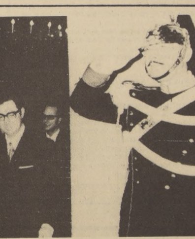
ROMA - El líder comunista Luigi Longo, a su llegada al Palacio del Quirinal, para sostener al igual que los demás partidos políticos, conversaciones con el Presidente Giovanni Leone...