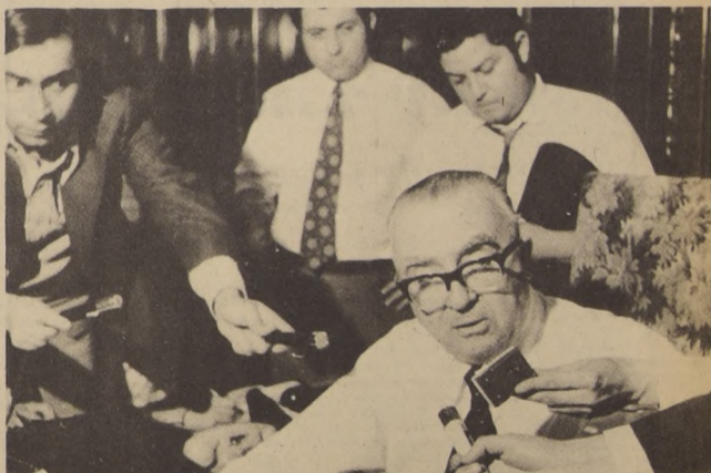
EN SU CALIDAD de Jefe del Gabinete, el Ministro Ríos Valdivia dio a conocer la renuncia de los Ministros de Estado. Todos ellos seguirán trabajando como de costumbre, puntualizó Ríos Valdivia, mientras el Presidente Allende toma una decisión.

En el considerando 24 la sentencia reproduce las palabras del ex Presidente Frei, que, en parte, dicen: