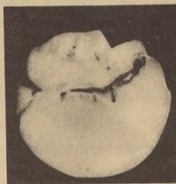
El daño que causa la Polilla Oriental de la Fruta se manifiesta en una de sus formas por la destrucción total de la pulpa que rodea al carozo o semillas. En el grabado un durazno en el cual se observa la larva de la Grapholitha molesta.

Esta plaga, que nuevamente tienen a la División de Sanidad Vegetal del SAG (anteriormente fue la Mosca Azul o del Mediterráneo) con todos sus efectivos en terreno y combatiendo arduamente, es un insecto que daña seriamente a los frutales, y fue detectada recientemente en Malloco, provincia de Santiago.