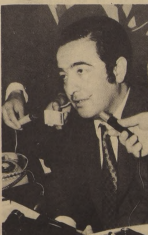
HERNAN DEL CANTO, Ministro del Interior: Tapabocas a los falsos patriotas.

El Gobierno permanecerá atento para perseguir con todo el rigor de la ley a los ejecutores materiales del agravio a la memoria de Prat, así como a los que lo hayan fraguado o se aprovechen de él para dañar la seguridad del Estado y el orden público.