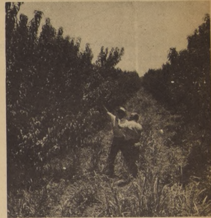
La colocación de trampas en predios frutales es un medio eficaz para descubrir focos de la Polilla Oriental de la Fruta. De esta manera el SAG adopta medidas para combatir la plaga. En el grabado dos técnicos del SAG del Área de San Felipe, en los instantes en que hacen el "chequeo" diario de las trampas. (FOTO CEDITEC-SAG).

y envases" señala en uno de sus puntos. Además "se prohíbe el transporte de duraznos, nectarines, ciruelos damascos, manzanos, perales, membrillos, guindos y almendros, tanto de la fruta como de las plantas, ramas y envases usados en esas especies cuando provengan de los departamentos de San Felipe y Los Andes, salvo cuando se posea una guía de libre tránsito otorgada por el Servicio Agrícola y Ganadero y en la que se certifique que están libres de esta plaga".