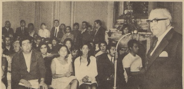
El Ministro de Educación, Alejandro Ríos Valdivia, se dirige a los 100 estudiantes que viajarán el próximo domingo a Cuba.