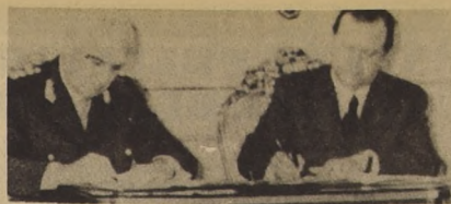
CARACAS. Venezuela. El Presidente de Argentina, General Alejandro Lanusse (izquierda), y su colega venezolano, Rafael Caldera, en los momentos que firman la declaración conjunta tras el tercer y último día de entrevistas que sostuvieron ambos mandatarios.

interior con tejidos animales o con vasos sanguíneos humanos. Al igual que el corazón natural, el artificial está dividido en dos aurículas y en dos ventrículos. El sistema de asistencia cardíaca fue implantado a un ternero en Waltham (Massachusetts). Es un cilindro de 7,5 por 20 centímetros que tiene un motor térmico en miniatura, con una fuente de calor nuclear alimentada por 100 gramos de plutonio 238 que da una energía equivalente a 500 watts. La cápsula pesa 2,700 kilogramos y está construida con tres capas de metal capaces de resistir la corrosión, impactos y temperaturas de hasta 30 grados centígrados. La mitad del plutonio desaparecerá en un período de 86 años y medio, pero el proceso de descomposición no ha provocado daño aparente en los animales, además la cámara de combustible está aislada. La cápsula de energía fue colocada en el abdomen y en el pecho se implantó una unidad de control. Los diseños y ensayos estuvieron a cargo de un equipo dirigido por el doctor Lowell T. Harrison. Se ha estimado que el número anual de candidatos potenciales a un trasplante cardíaco oscila entre 10.000 y 100.000. En los últimos años el interés en los trasplantes de corazones, todos humanos, ha decaído sensiblemente debido a las complicaciones que se presentan. Las enfermedades cardiovasculares causan un millón de muertes anualmente en Estados Unidos y dejan parcialmente inválidos a centenares de miles, según estimaciones oficiales.