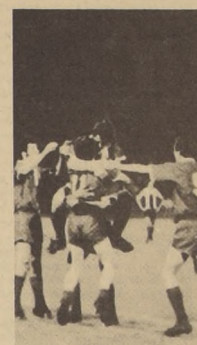
La alegría efímera. La celebración del empate transitorio de la "U". Un minuto más tarde, otra falla defensiva azul permitió el tercer tanto de Alianza.

Habría que esperar a San Felipe, este equipo en el cual nadie cree, ese grupo de gente sencilla y luchadora que desde su concentración en el paraje cordillerano de Las Ventanas espera confiado el momento de mostrar su verdad. Porque los sanfelipeces han rendido cualquier tipo de exámenes en nuestro medio, con equipos caseros. Ahora le queda su examen de grado, en su debut en el campo internacional.