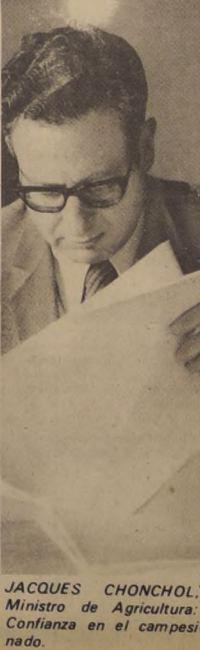
JACQUES CHONCHOL, Ministro de Agricultura. Confianza en el campesinado.