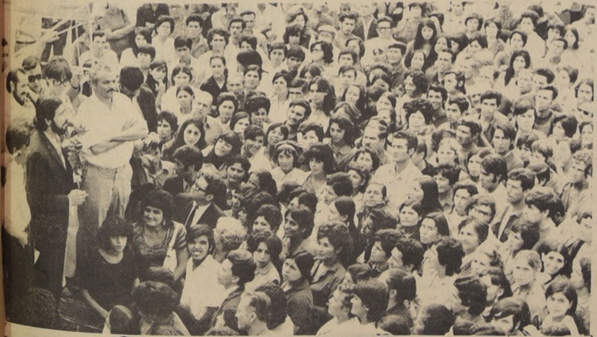
El Gobierno Popular ordenó la requisición de Comandari y Ceresita. La primera porque especulaban con los precios, y la segunda porque utilizaban aceite comestible para fabricar pinturas. En el grabado mandari, el director de DIRINCO, dialoga con los obreros de Comandari. En la otra nota gráfica el Ministro Vuscovic examina la requisición de 350 tambores de aceite encontrados en Ceresita.

Más tarde el Ministro Vuscovic ofreció una conferencia de prensa en la que dio cuenta que en el día de ayer se habían ordenado diversas sanciones a algunas tiendas de calzado. En total la DIRINCO requirió 47 mil pares de zapatos. Las tiendas afectadas son Opaline, Ruiz e Hijos, Beltrán y Larriborde, Amalión, Aysaguer y Alam y Cia. Todos estos comerciantes se practican cuantiosos stocks en sus bodegas que no estaban a la venta y que aparecían sin su precio marcado. Se trataba de esperar una posible alza. Pero el Ministro fue bastante claro al respecto: "No toleraremos ningún chantaje y nos hemos negado a revisar los precios mientras no se normalice el abastecimiento".