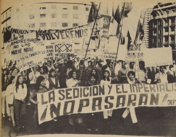
La juventud trabajadora estuvo valientemente en las calles. Expresaron su repudio a la reacción.

Juvenil del MAPU también dio a conocer su posición frente a esta enmascarada de la derecha reaccionaria que tiene como objetivo básico derribar al Gobierno constitucional de Chile. Junto con hacer un llamado a la Juventud Demócratacristiana a participar como organización y frente de masas, llama a los jóvenes de Chile a desarrollar realmente la discusión a nivel nacional, sobre los deberes y derechos de la juventud en este proceso de cambios que vive el país.