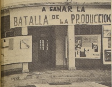
PARTE DE LA importante exposición que los servicios del Agro montaron en la ciudad de Cabildo, en la zona de Aconcagua.

La delegación está integrada por 80 oficiales, encabezados por el Director del Colegio de Defensa de los Estados Unidos, que se encuentran realizando un viaje por América Latina.