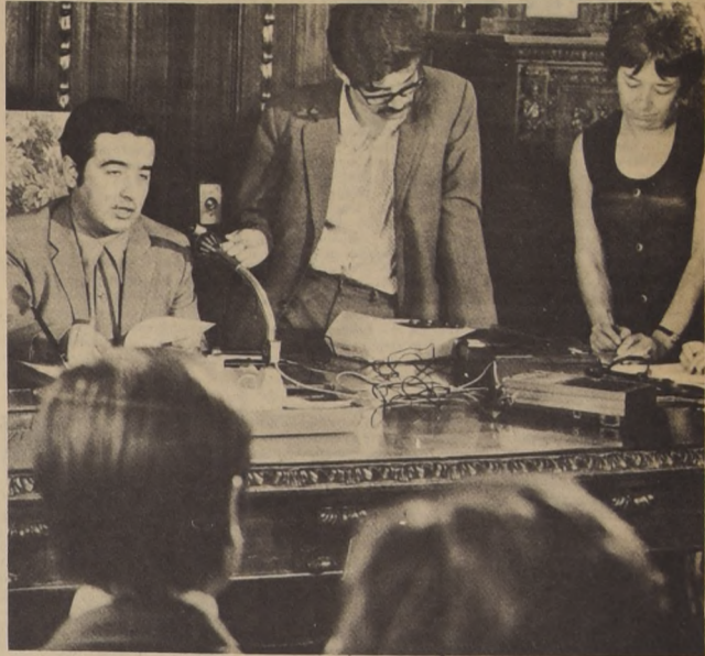
El Ministro del Interior, Hernán del Canto, en la conferencia de ayer.

A medida que analizaba las palabras del prisionero de la reacción, Del Canto reiteró que ni estas palabras ni otras actitudes, hechos o publicaciones, impedirían que el proceso revolucionario que sigue Chile no se cumpliera ni siguiera adelante.