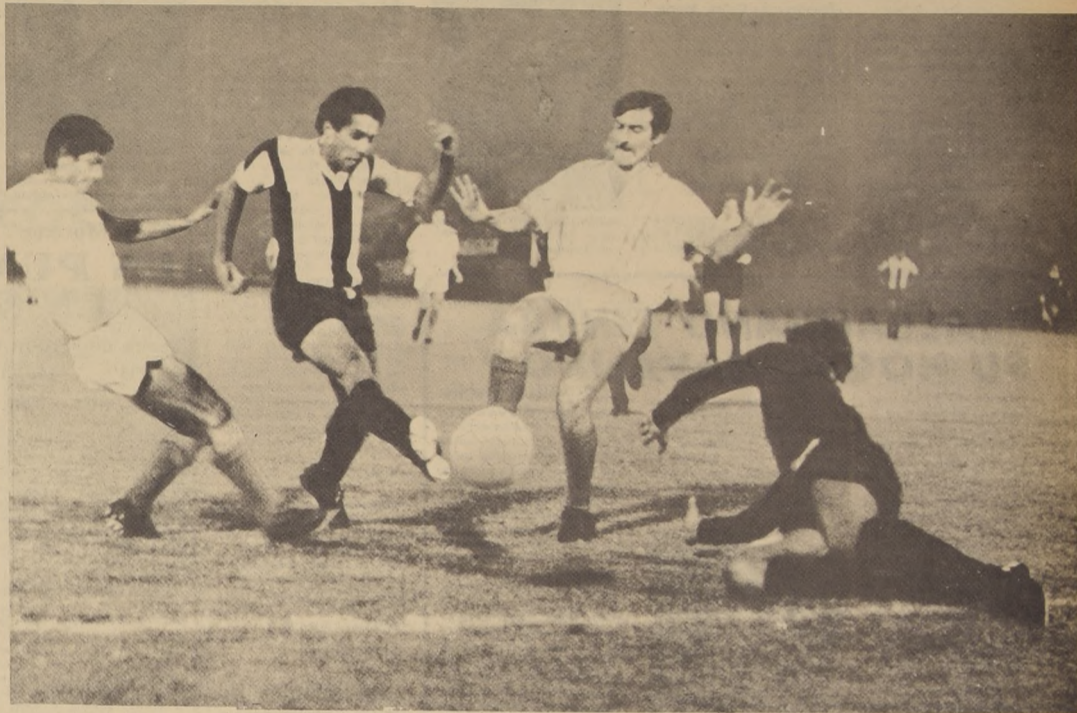
CON LA DECISION de costumbre, San Felipe afrontará el compromiso de esta noche frente a Universitario.

El ganador del grupo 4 puede ser un elenco nacional o peruano, más no es lo más importante. Lo realmente importante ya se ha producido.