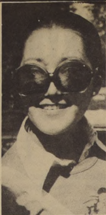
No me cabe duda que detrás de todo está la CIA...