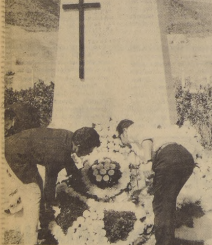
HACE 7 AÑOS, el 28 de marzo de 1965, el pueblito de la Compañía Minera Disputada de Las Condes vivía un apacible día domingo. Todo era normal y nada hacía presagiar la desgracia que cobraría 400 víctimas. Exactamente a las 12:53 minutos, el terremoto que asoló la zona soltó el dique de contención de las aguas de relave que se encontraba a 50 metros de distancia. En pocos minutos, todo el pueblo desapareció bajo una avalancha de barro y piedras. Ayer, en el mismo lugar del drama, en el Parque Nacional del Cobre, se realizó un acto de conmemoración en el cual participó la banda de la Guarnición de Quillota. Luego del izamiento del pabellón patrio, se efectuó una misa de campaña oficiada por el obispo de Valparaíso, Monseñor Emilio Tagle Covarrubias. Con posterioridad a la colocación de ofrendas florales en el monumento erigido en memoria de las víctimas del terremoto, se realizó una romería hasta el Cementerio de la Municipalidad de Nogales.

El alegato del abogado del Ministerio del Interior resultó memorable, porque demostró en el foro hasta que punto llega la peligrosidad de esta organización fascista, haciendo claras comparaciones con el partido nazi que encabezó Adolfo Hitler. Por desgracia nuestra justicia parece no ver peligros en la libertad de estos facciosos.