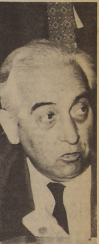
RAFAEL AGUSTIN GUMUCIO denunció en el Senado los intentos reaccionarios de impedir una investigación a fondo. "¿Qué teme la Derecha para asustarse por la investigación del complot de la ITT y la CIA?"

ción dejaban la impresión de que había sectores que pretendían impedir una investigación a fondo. Más adelante señaló el senador Gumucio, "nadie aquí ha adelantado juicios respecto a los nombres de políticos que han estado mezclados en este complot. Y sí de la investigación salen nombres, nosotros nos reservamos el derecho de enjuiciarlos a su debido tiempo."