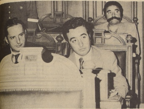
EL MINISTRO DEL INTERIOR, Hernán del Canto, escucha las intervenciones de los diputados en la sesión de ayer. Una viril respuesta se llevaron los derechistas que insultaron al Cuerpo de Carabineros.