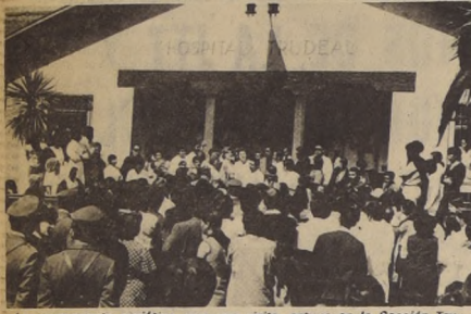
La cosmonauta soviética, que nos visita, estuvo en la Sección Trudeau del Hospital Barros Luco. Allí dialogó con los trabajadores de la Salud.

Estamos conformes con que Valentina obtenga el honor que merece en nuestra ciudad, pero al mismo tiempo, pensamos que, dada la calidad de la hazaña que cumplió en favor de la Humanidad, habría sido más propio entregarla la condecoración MAXIMA que entrega Valparaíso y que es la que tiene rango para Jefes de Estado o personas que han realizado una labor a nivel mundial. ¿Qué más universal que una vuelta al mundo en una cosmonave?