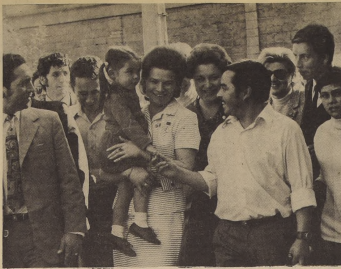
Valentina Tereshkova visitó la fábrica textil Fabrilana, que pertenece al Área Social. Conversó con los trabajadores y trabajadoras. Estas, especialmente, mostraron gran interés en saber cómo se emancipó la mujer en la URSS. También inquirieron datos sobre la educación de los niños. Y Valentina respondió que en la

Unión Soviética, la enseñanza es preocupación del Estado. Desmintió que en su país los hijos fueran quitados a sus madres. EN LA FOTO, junto a miembros de su comitiva y trabajadores. Valentina lleva en sus brazos a la hija de un matrimonio obrero.