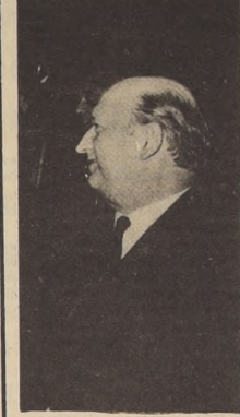
Volodia Teitelboim habló a nombre del Partido Comunista en la sesión del Senado.