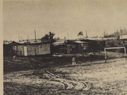
El Jefe del Estado, apenas conoció las proyecciones del impacto causado por las lluvias prolongadas, no sólo convocó al Consejo de Gabinete para considerar las medidas a tomar, sino que también visitó los sectores afectados. Entre ellos, los campamentos "Manuel Rodríguez" y "Luciano Cruz" y la Población "Tencha Busi de Allende".