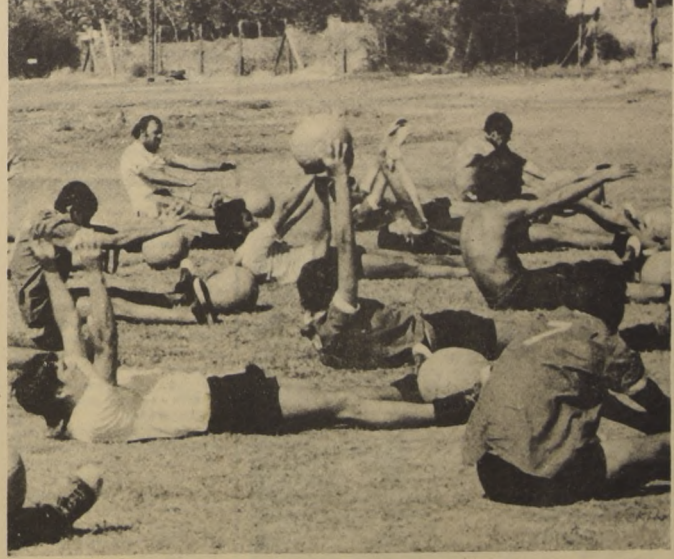
A pesar del estado de la cancha de Santa Rosa de Las Condes, Universidad Católica entrenó en forma normal.