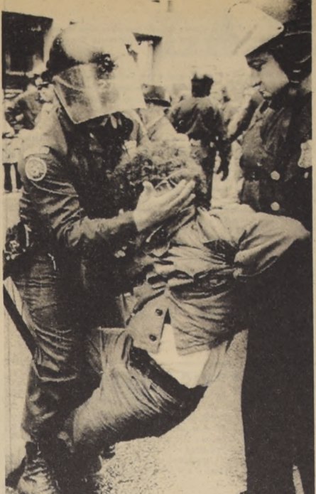
BOSTON — Policias contienen a uno de los manifestantes que participaban en la protesta que contra la guerra realizaron más de mil estudiantes frente al edificio federal "John Kennedy". La tensión provocada por la medida del Presidente Nixon de bloquear el puerto de Haiphong, ha aumentado en diversas universidades del país; en las que los alumnos han manifestado su desaprobación.