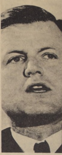
SENADOR EDWARD KENNEDY.