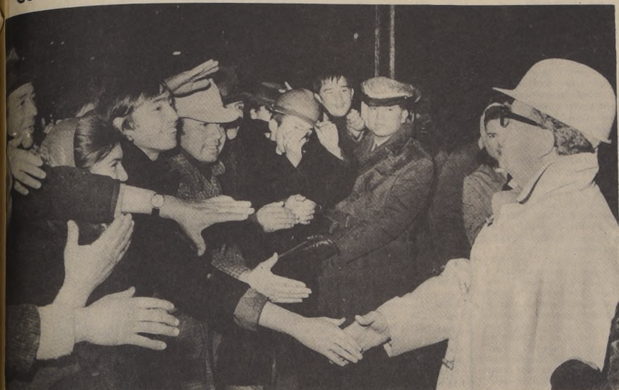
LA INSISTENTE LLUVIA fue obstáculo para que miles de trabajadores, como ocurrió en Lota, esperaran al Presidente Allende para expresarle su reconocimiento y aprecio.

Actividades del Jefe de Estado en las provincias de Concepción y Bío-Bío.