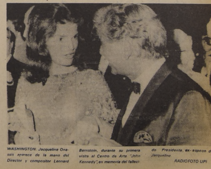
WASHINGTON Jacqueline Onassis aparece de la mano del Director y compositor Leonard Bernstein, durante su primera visita al Centro de Arte 'John Kennedy', en memoria del fallecido Presidente, ex-esposo de Jacqueline.

Por la noche, el Primer Ministro cubano, fue condecorado con la 'Orden de la Bandera' de la República Popular de Hungría.