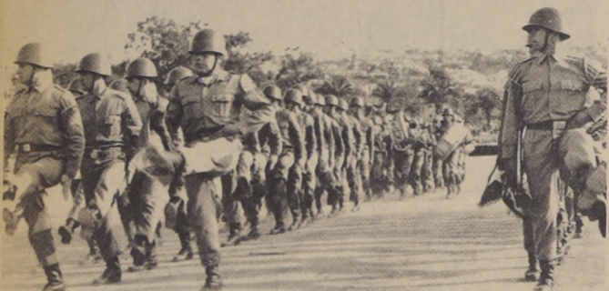
Hoy miércoles será conmemorado en el Regimiento de Infantería y Llanura N° 2, MAIPO, el 92 Aniversario del DÍA DE LA IN-