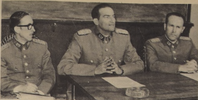
Alto Mando Militar Deportivo, dio a conocer ayer a los periodistas, la idea de copar Chile con todas las disciplinas deportivas.

En la quinta y sexta zona (Rancagua-Talca y Concepción) comenzó el sábado último el Campeonato Nacional de Tenis de Mesa a nivel de clubes. Este torneo, en el cual participan 32 asociaciones, se desarrolló en 8 zonas, desde Arica hasta Puerto Aysén.