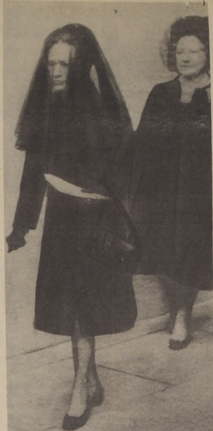
LONDRES. La Duquesa de Windsor, viuda del fallecido Duque Eduardo, acompañada por la Reina Madre de Inglaterra, se despiden de la Duquesa en el sepelio del ex-rey Eduardo VIII.