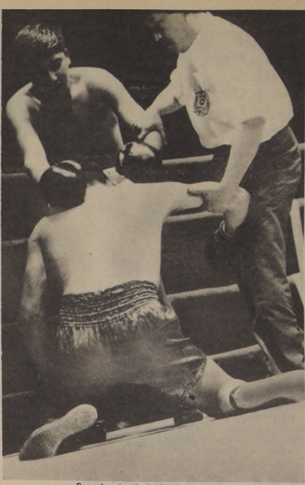
Se peleará a lo "milico", hasta que se caiga el otro.

La fiesta del boxeo militar ya echó las bases para repetirse en Chile, dentro de un par de días. Ayer en el Regimiento Tacna las autoridades militares, citaron a conferencia de prensa para explicar con la claridad de un "milico" el gran campeonato que comenzará en La Serena y Rancagua.