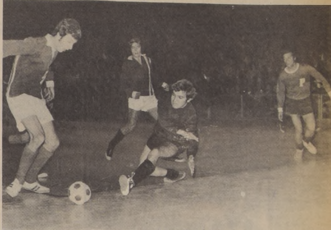
Juegan los artistas y los "portalianos".

Los trabajadores de esa casa radió pensaron que al público no se le debía cobrar entrada, pero quienes asistieron al Estadio Chile deberian aportar útiles escolares NUEVOS (un lápiz, una goma, un cuaderno...) que irian a favorecer a los menores que se albergan en los hogares de carabineros. En la puerta del Estadio, funcionarios de la radio estuvieron recibiendo las donaciones, que sumaron miles y miles de útiles escolares.