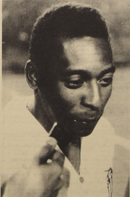
PELE: gran ausente en el scratch brasileño que hoy enfrenta a la selección de Checoslovaquia.

Los cronistas deportivos locales no ocultan su recelo ante las malas actuaciones de los goleadores y del zaguero central izquierdo de la selección brasileña; tanto el goleador titular, Leao, como el reserva, Sergio, vienen siendo criticados por la dificultad que tienen en salir hacia las pelotas altas. También el zaguero Vantuir, quien hace su estreno en el equipo, ha sufrido críticas por no hacer con seguridad la cobertura del área.