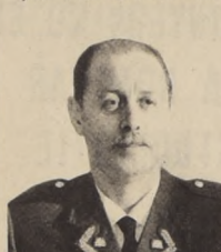
ASCENSO DE DOS GENERALES DE LA FUERZA AEREA

Esta asistencia entregada por el Gobierno Cubano es el resultado del compromiso que ofreció a este establecimiento el Primer Ministro Cubano, Fidel Castro, y el Ministro de Educación de ese mismo país en su gira por el sur del país. Cumpliendo este ofrecimiento se encuentra ya en Ministerio de Educación el Material didáctico que se entregará a esta Escuela junto con la ampliación realizada por la Sociedad Constructora de Establecimientos.