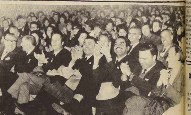
CERCA DE 2.500 funcionarios de Impuestos Internos han participado en la Campaña Nacional de Fiscalización de Impuesto de

El Director de ODEPA, Samuel Goldzweig, manifestó que se están tomando las medidas del caso para entregar las semillas certificadas a los pequeños productores y campesinos en el curso de estos días, ya que las siembras se realizan hasta el mes de julio. Por otra parte, se utilizarán los créditos normales a través del Banco del Estado y del Instituto de Desarrollo Agropecuario para los productores del Norte Chico.