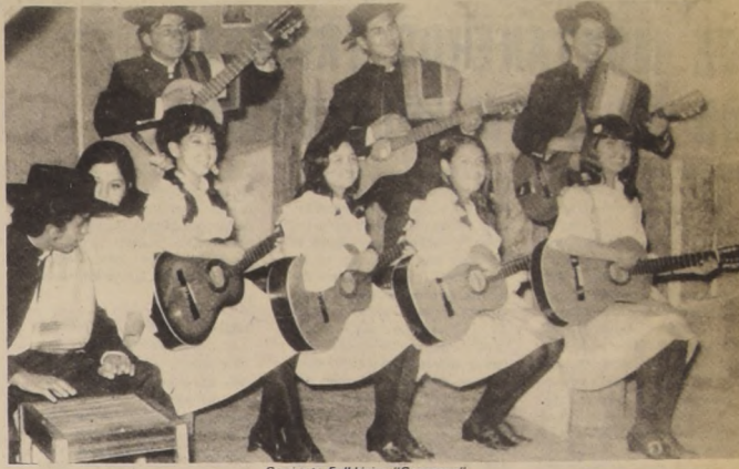
Conjunto Folklorico "Graneros".

que es la de dar a conocer nuestro Arte Popular chileno, labor que la Facultad de Música desarrolla en forma ininterrumpida desde noviembre de 1970, en recintos cerrados y al aire libre. Sobresaliente ha sido la participación de MARGOT LOYOLA, CONJUNTO "CUNCUMEN", "GRUPACION FOLKLORICA CHILENA", CONJUNTO "MILLARAY", GRUPO "DEL ALBA", CONJUNTO "COYAHUE", HERMANAS FREIRE, CONJUNTO LA RANCHA, CONJUNTO "MILLANTU", LOS DE LA COSTA, residentes en Arica, etc. Los conjuntos folklóricos "GRANEROS" y "TRAYEN" se suman a esta larga lista de grupos artísticos. Venidos de la provincia de O'Higgins —residen en el pueblo de Graneros— no han escatimado esfuerzos para llegar hasta la capital, y mostrar los cantos y danzas tradicionales recogidos e investigados por ellos mismos. El conjunto "GRANEROS", está compuesto fundamentalmente por trabajadores agrícolas, empleados y profesores; han participado en diversos festivales ganando el primer premio en el Festival de Nuñoa en 1971. Su trabajo artístico es dirigido a los sindicatos, escuelas, centros comunales e Institutos Culturales. El viernes 30 de junio se presentarán, auspiciados por la Facultad de Ciencias y Artes