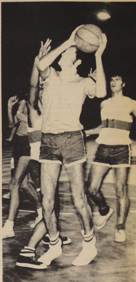
LA ESCENA VUELVE A REPETIRSE hoy en Recoleta y en el Nataniel. Nuevamente se enfrentan las Selecciones Universitarias.

En general todos los jugadores coinciden en que su actuación estuvo dentro de lo normal, recalando que es cierto que hubo superación de algunos jugadores que no salieron de Chile con el respaldo general y amplio.