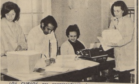
LOS CURSOS por correspondencia han encontrado amplia aceptación entre los trabajadores. En la foto, funcionarios del Instituto Laboral controlan la cartas que les llegan de todo el país.

Como se puede apreciar, algo se ha hecho al respecto, pero falta mucho más, para llegar a la capacitación que se quiere de los trabajadores de nuestro país. El plan y las recomendaciones para llevar a cabo esta tarea de tanta importancia están dados. Ahora sólo falta que todos los sectores colaboren, a fin de que su puesta en marcha sea expedita y el éxito completo corone los esfuerzos que en conjunto todos los chilenos deben realizar con este objeto.