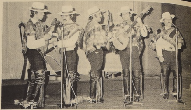
Los Montaneros, grupo familiar que triunfa con su Show folklórico internacional en el Casino Municipal y que cosecha aplausos en cada una de sus presentaciones.

Corresponsalía del Diario "La Nación" Condell 1281 Teléfono 50778