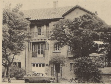
UNA ACTIVA labor dentro de las tareas de capacitación de los trabajadores, ha cumplido el Instituto Laboral. En la foto, su sede ubicada en calle Iriana.

LA CAPACITACION es una de las aspiraciones más sentidas por miles de trabajadores, al mismo tiempo que constituye una de las mayores necesidades del país. Los hombres de trabajo que reciben la capacitación que precisan, por lógica tienen que rendir más y mejor, lo cual trae como consecuencia un mayor rendimiento en la producción, se asegura una excelente calidad, traduciéndose esto en economía para la Nación. Por esta causa el problema de la capacitación es mirado con gran interés por las autoridades de Gobierno, lo cual se refleja en el informe sobre el problema de la capacitación, contenido en la Memoria 1971 del Ministerio del Trabajo.