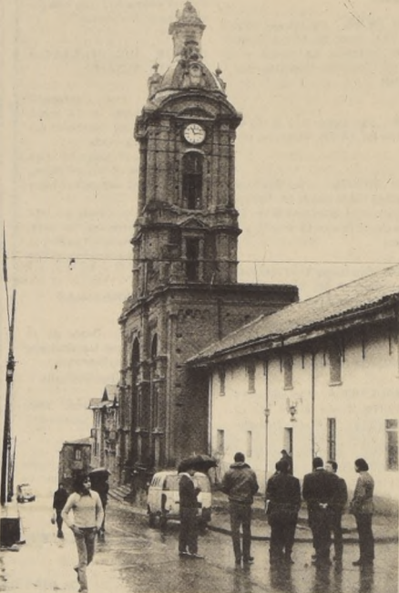
La Iglesia San Francisco del Cerro Barón, cuya alta torre sobresale en la topografía porteña, será iluminada por la Municipalidad de Valparaíso con lo cual no solamente podrá ser vista de noche desde cualquier punto de la ciudad, sino desde el mar y la bahía. La Iglesia y antiguo Convento Franciscano es otra de las reliquias históricas del primer puerto.