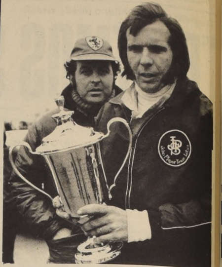
EMERSON FITTIPALDI primera opción en GP de Francia

FITTIPALDI FAVORITO EN EL GRAN PREMIO DE FRANCIA