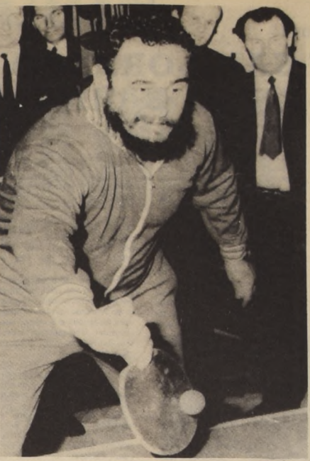
PRAGA, Checoslovaquia. El Primer Ministro cubano, Fidel Castro, luciendo tenida deportiva durante un encuentro de ping-pong que sostuvo en la región montañosa de Eslovaquia, durante su visita a la nación checa.

soviéticos, se supo aquí de fuentes comunistas. La delegación soviética estaba presidida por Leonid Brezhnev, Secretario General del Partido Comunista de la URSS.