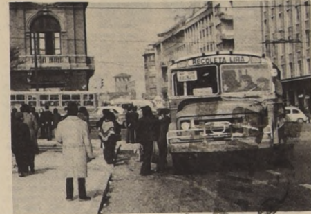
PARADEROS de microbuses atestados de gente, en todas las calles de Santiago, esperando por cualquier medio de locomoción que los acercara a sus hogares o lugares de trabajo, fueron las escenas que se registraron ayer al prolongarse por segundo día el paro decretado por los choferes de la locomoción colectiva particular.