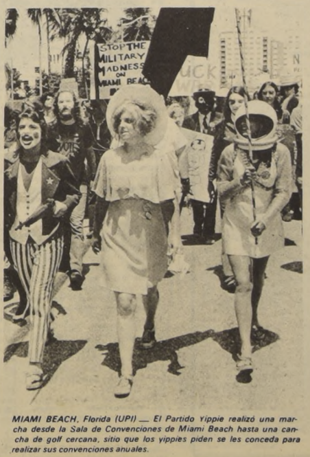
MIAMI BEACH, Florida (UPI).—El Partido Yippie realizó una marcha desde la Sala de Convenciones de Miami Beach hasta una cancha de golf cercana, sitio que los yippies piden se les conceda para realizar sus convenciones anuales.