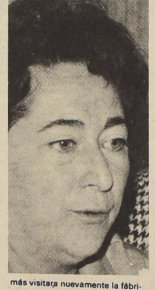
Más visitara nuevamente la fábrica, ya que le tendrían "otra sorpresa". Posteriormente la Ministra se trasladó al Casino, donde habló con los trabajadores. Se refirió en concreto a su nueva política de diálogo y anunció visitas a otras industrias.

Una visita que calificó como muy productiva, fue la que realizó ayer la Ministra del Trabajo, a la industria textil Sumar. Allí dialogó con los trabajadores, supo de sus problemas e incluso se encontró con la sorpresa de que un grupo de obreros y empleados había inventado una máquina que permitirá aumentar notablemente la producción en su departamento. Mireya Baltra llegó a Sumar poco antes del mediodía, siendo recibida por un grupo de trabajadores. De inmediato visitó diferentes secciones, invitando a los periodistas que la acompañaban a dialogar con los obreros y empleados.