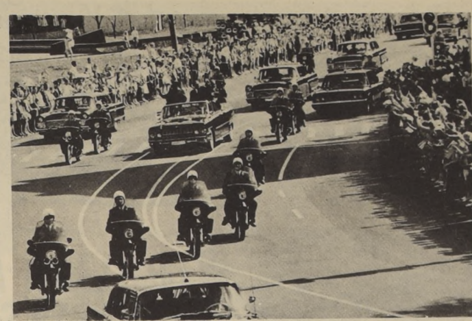
A INVITACION DEL CC del PCUS y del Gobierno soviético, llegó a Moscú en visita oficial amistosa Fidel Castro Ruz, Primer Secretario del CC del Partido Comunista de Cuba y Primer Ministro del Gobierno Revolucionario de la República de Cuba. En el grabado, el cortejo solemne por las calles de Moscú.