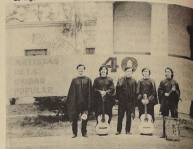
INTI ILLIMANI , el prestigioso conjunto chileno, conversó con La Nación dando a conocer diversos pormenores de su nueva gira por países de América Latina. Gira que comprendió la visita a Cuba, México, Costa Rica, Venezuela, Colombia y Ecuador, auspiciada por la Secretaría Nacional de Extensión y Comunicación de la UTE y DICAP.