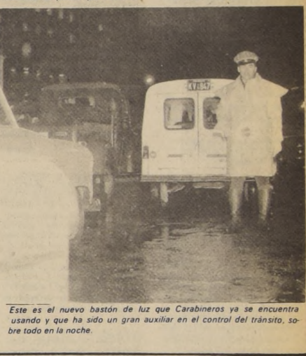
Este es el nuevo bastón de luz que Carabineros ya se encuentra usando y que ha sido un gran auxiliar en el control del tránsito, sobre todo en la noche.