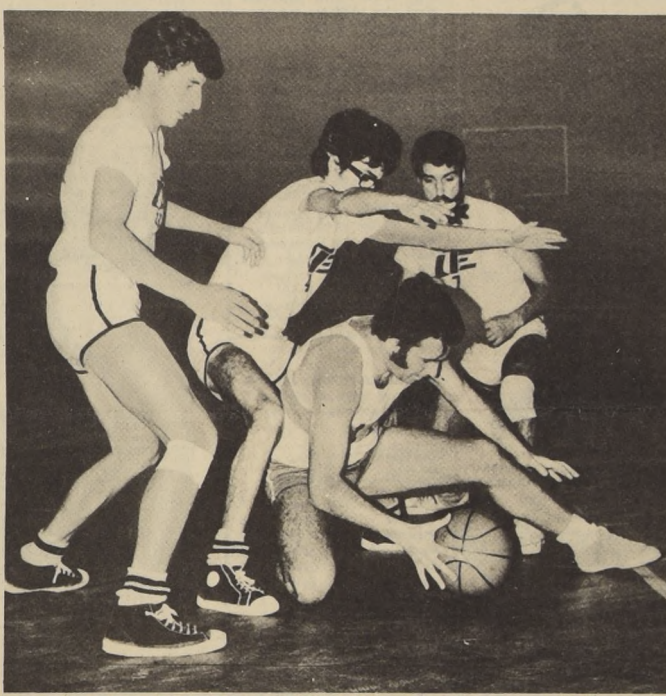
Básquetbol: LA UC y la Técnica, dos universidades que empatan el primer lugar y deben definir.

Ventuna asociaciones se inscribieron para participar en el Campeonato Infantil de Pimpon de Mesa, que se realizará en Santiago los días 12, 14 y 15 del presente mes. La cantidad de jugadores que se inscribieron es de 83, de los cuales 35 son varones y 48 damas. Las asociaciones que estarán presentes en esta verdadera fiesta del pimpon "joven" son las siguientes: La Asoblanca, Chuquicamata, Talcahuano, Universidad de Concepción, Valdivia, Valparaíso, Viña del Mar, La Cisterna, Las Condes, Metropolitana de Ñuñoa y Santiago. San Antonio y La Serena presentaron sus inscripciones fuera de plazo, motivo por el cual no podrán participar. El torneo se desarrollará en el gimnasio del Colegio Calazans, que fue cedido en forma gratuita por Javier Pertierra, Rector del establecimiento educacional. El costo del certamen es de $70.000 y correrá por cuenta de la Federación. Estarán en disputa 12 títulos nacionales.