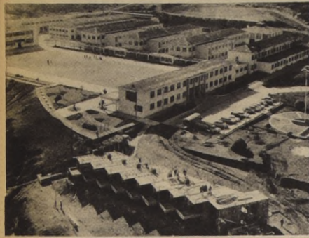
Escuela de Ingeniería Naval celebró su 83° aniversario de existencia en el Sector Naval Oriental de Las Salinas, en Viña del Mar. El grabado ilustra una visión aérea de sus reparticiones, donde se realizó la ceremonia de celebración.

Anual... $ 680 Semestral... 345 Trimestral... 176