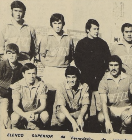
ELENCO SUPERIOR de Ferrovianos, de irregular desempeño