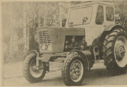
Uno de los tractores soviéticos marca Belarus, que arriban a nuestro país en motonave de Empremar el próximo 15 de agosto.

Por tratarse de la primera partida de tractores de la URSS, llegados a Chile, hay la posibilidad de que el desembarque cuente con la asistencia del Embajador de dicho país y de ejecutivos de la Empresa Marítima del Estado.