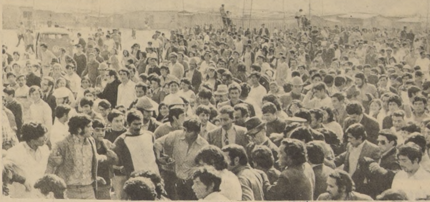
La calidad humana de los pobladores y su responsabilidad les llevaron a proteger ellos mismos a su Presidente. En la escena la cadena que formaron para permitir el paso del Primer Mandatario.