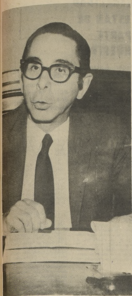
CARLOS ALTAMIRANO: Secretario General del Partido Socialista