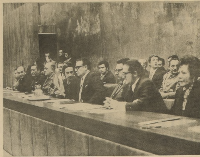
El Presidente Salvador Allende hizo un llamado a la comunidad a participar en el Plan Nacional de Reparación y mantenimiento de locales escolares.