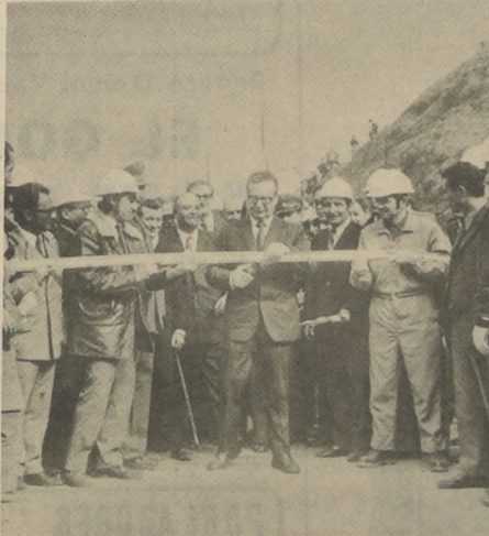
Salvador Allende cortó la cinta tricolor, inaugurando definitivamente el túnel de Chacabuco.

Por otro lado, la plaza de peaje instalada en su acceso sur, contabilizará inicialmente cerca de 800 pasadas diarias, durante los días de semana, y cerca de 1.500 en sábados y domingos.