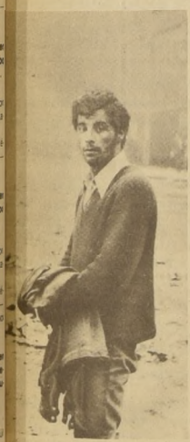
Este "alumno" agrupado en FESES, dirigió en el día de ayer los grupos que apedrearon los negocios, levantaron barricadas y provocaron a las fuerzas del orden. Era un "líder estudiantil" muy especial.