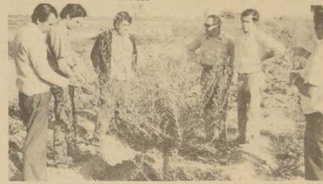
MIEMBROS DE LA COMISION Nacional Fruticola observan nuevas plantaciones de olivos que está realizando el SAG y la CORA en el Valle de Azapa.