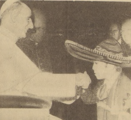
CASEL Gandolfo — Italia — Paulo Sexto es besado en la mano por un pequeño mexicano que, ataviado con traje típico de su país y portando un violín, ofreció una serenata al Pontífice, durante la audiencia general celebrada en su lugar de descanso.

BUENOS AIRES (ANSA). La coalición interpartidaria denominada "Hora del Pueblo", integrada por los partidos Peronista y Radical, las dos agrupaciones de mayor caudal electoral en Argentina— entró en una crisis que, a juicio de los observadores, puede desembocar en su definitiva ruptura. Las discrepancias entre radicales y peronistas culminaron anoche en graves enfrentamientos durante una asamblea de la agrupación, que impidió la emisión de un comunicado referido a la actual situación política, objetivo de la asamblea según se había anunciado. La "Hora del Pueblo", se había formado en diciembre de 1970 —Posteriormente el Gobierno Livingston— con la proclamada finalidad de sustentar un común acuerdo acerca de la necesidad de una balanza política-electoral. La coalición en ningún momento respondió a fines de frentes electorales, sino que buscaba coincidencias en el camino hacia