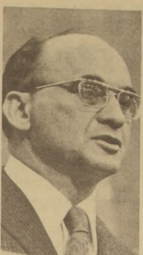
Presidente de México, Luis Echeverría