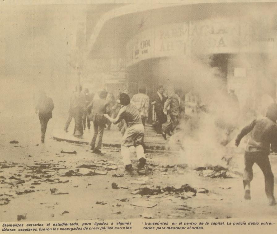
Elementos extraños al estudiantado, pero ligados a algunos líderes escolares, fueron los encargados de crear pánico entre los transeúntes en el centro de la capital. La policía debió enfrentarlos para mantener el orden.