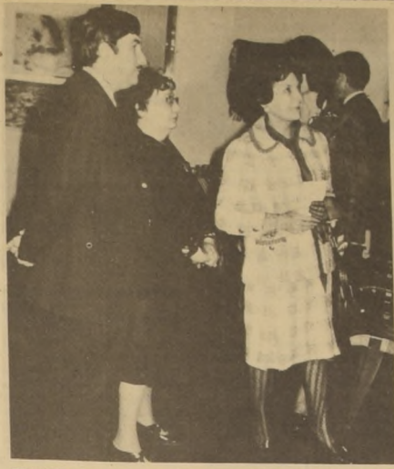
PRIMERA DAMA VISIÓ MUESTRA RUMANA DE ARTESANIA. En la Sala de Exposiciones de la Universidad de Chile se inauguró oficialmente la Muestra de Folklore de Rumania...