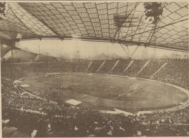
EL POLIDEPORTE OLIMPICO 1972. En este Estadio con capacidad para 80 mil personas, de las cuales 47 mil son plazas sentadas, se realizó la ceremonia inaugural y se están efectuando las pruebas atléticas...

MUNICH 1 (AFP). Cuba venció hoy aquí con cierta comodidad por 84 a 70 a Australia en un encuentro del grupo "A" del torneo olímpico de baloncesto.