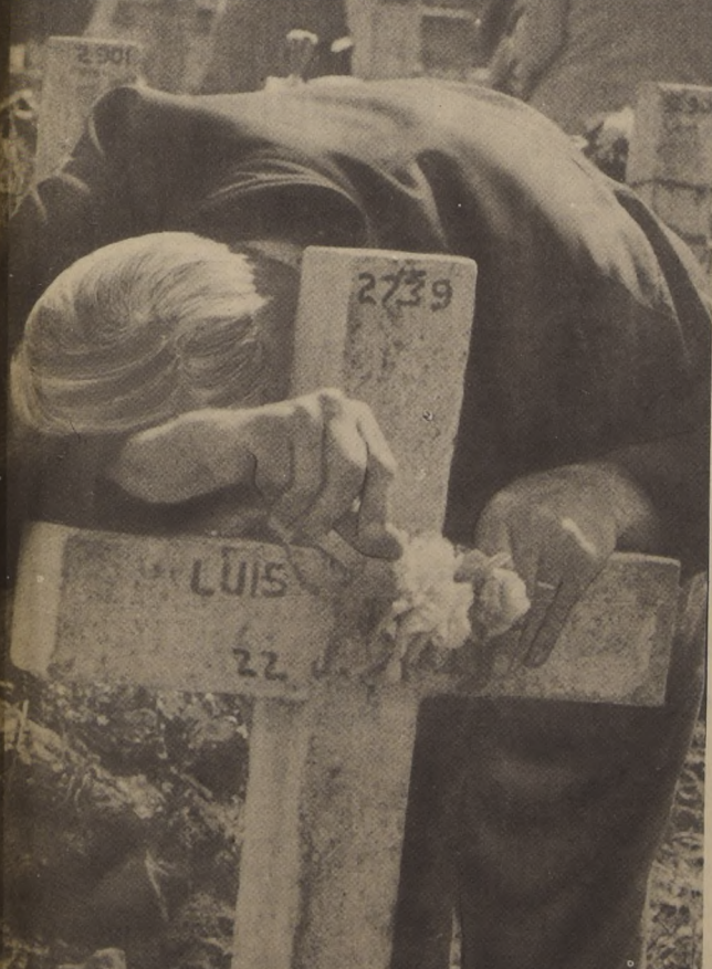
La multitudinaria agitación de la romería a los cementerios del Día de Todos Santos, abrió, como instantes en que las lágrimas del recuerdo se desbordaron incontenibles. Una hija que lloraba al padre muerto, una hermana, una madre o un esposo... Había emoción, sentimiento pena, dolor, ausencia, amor, conformidad frente a la muerte, no unas muertes cualquiera, sino la de un ser querido, la de un compañero de una vida entera... Y por eso, este anciano, teniendo en sus manos una sencilla rosa blanca, llora, la desesperada soledad por el hijo que fue su primavera y que hoy yace bajo esta fría cruz de concreto.