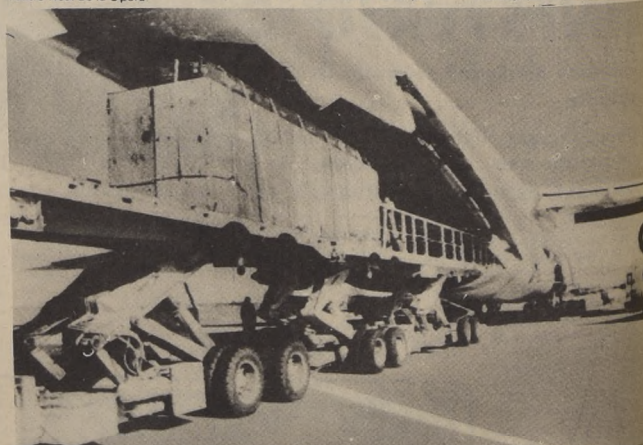
Saigon, Vietnam del Sur. Gigantescos aviones de transporte de EE. UU. desembarcan gran cantidad de petreos militares...