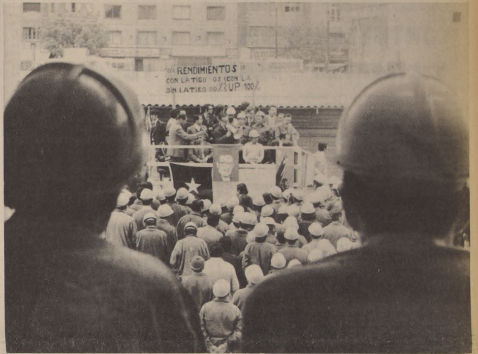
Tras las dos columnas que significan estos trabajadores de DESCO, se puede observar la tribuna donde está hablando el Compañero Presidente de la República, Allende concurrió hasta donde esos trabajadores para prestarles su apoyo ante la actitud asumida por esa Empresa de neto carácter revanchista. Trabajadores de DESCO fueron despedidos por no aceptar el paro nacional de los empresarios del rodado.

La cita será a las 18 horas el próximo jueves en la Alameda Bernardo O'Higgins.