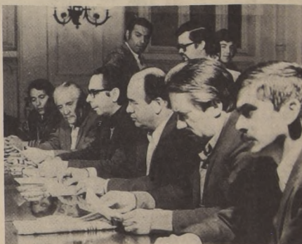
Dirigentes del Comité Central del Partido Socialista ofrecieron una conferencia de prensa para informar en detalle respecto a las materias tratadas en el último Pleno Nacional de esa colectividad, realizado en la localidad de Coya.

Los socialistas se proponen realizar una Conferencia Nacional Sindical de la organización a fin de apretar filas dentro de la CUT y demás organizaciones de masas.