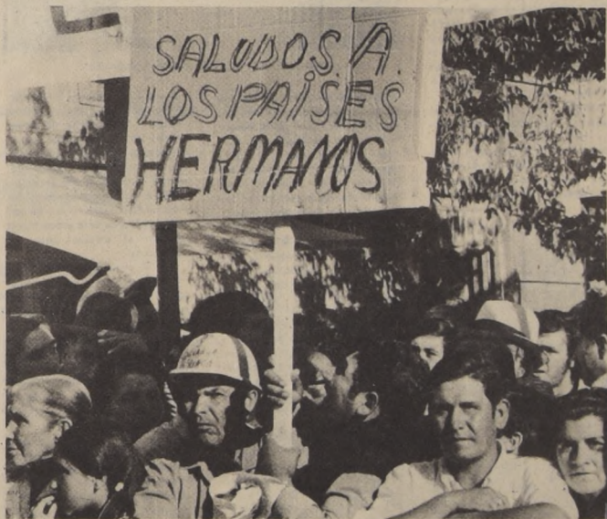
TRABAJADORES, MUJERES Y PROFESIONALES se dieron cita ayer en la Alameda para despedir con una multitudinaria concentración al Presidente Allende quien inicia mañana su gira por los países amigos.

Así fue una celebración más del triunfo de la Unidad Popular, la que revisó ribetes únicos antes demostrados, ya que tanto mujeres, jóvenes, trabajadores, empleados y caravanas de taxistas repletaron la Alameda para escuchar las palabras del Presidente Salvador Allende.