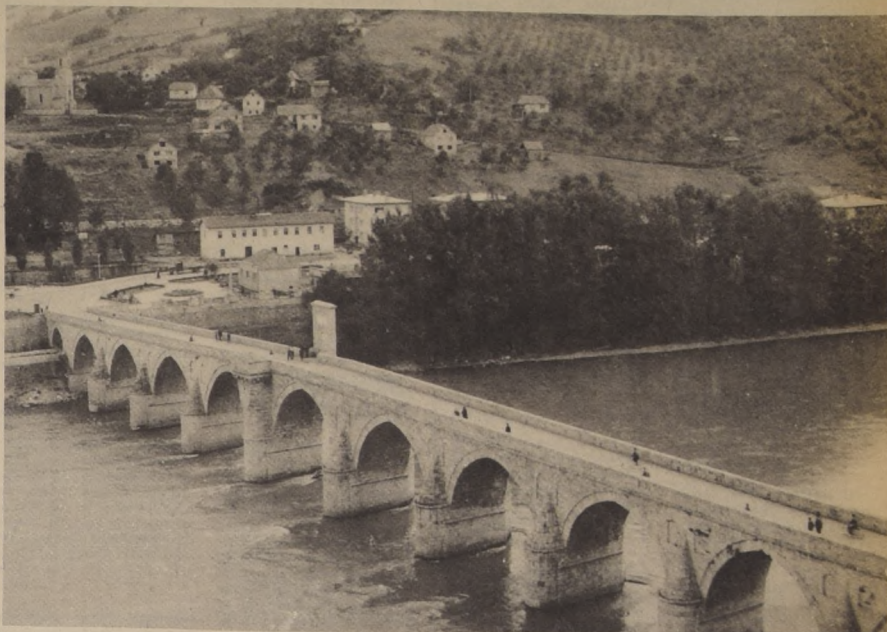
Puente sobre el Drina (Bosnia y Herzegovina) construido en 1571 por el célebre arquitecto otomano Sinan.

El sistema autogestivo-mercantil yugoslavo despertó la iniciativa de los hombres y las empresas. La esencia de toda la cuestión lo sigue siendo siempre el permanente aumento de la producción. Mientras tanto, no se olvidó de que la cantidad permite que se viva y de que únicamente los productos cualitativos ofrecen la posibilidad de que se viva mejor. Los extranjeros bienintencionados pueden ver de que muchas cosas, como por ejemplo las vitrinas con mercaderías a lo largo del país, la gran cantidad de automóviles y el intenso tráfico por las calles, las viviendas de alto standard, aunque el problema de la vivienda sigue