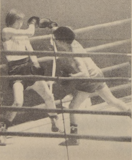
LA TÓNICA DEL CAMPEONATO: atropellar y pegar.