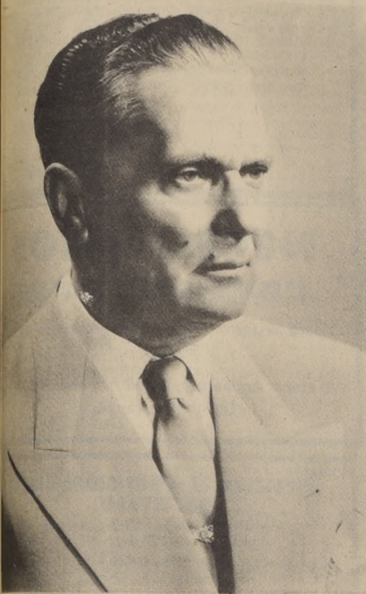
EL MARISCAL JOSIP BROZ TITO

NUESTRO HOMENAJE A LA REPUBLICA DE YUGOSLAVIA EN SU DIA NACIONAL