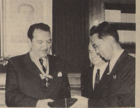
El Gobierno Popular de la República Democrática de Corea condecoró recientemente al actual diputado por Santiago, ex Presidente del Partido Radical...