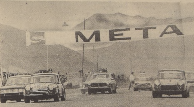
Lamentablemente, por razones de fuerza mayor, fue postergado para el año próximo el evento ya tradicional en nuestro medio: 'Las Seis Horas de Chile'.

45 máquinas largaron el G. P. Santiago - Temuco.