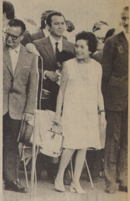
Las jóvenes subieron hasta el escenario principal para hacer entrega a la Primera Dama de un hermoso canastillo de flores, símbolo del afecto que sienten el pueblo trabajador, por su Gobierno. Junto al Primer Mandatario se ubicó el Ministro del Interior General Carlos Prats y el resto del Gabinete, para escuchar el discurso de despedida del Jefe del Estado antes de iniciar su gira mañana a las 9 horas.

El pueblo de Santiago, que al partir formó tres columnas, que partieron desde la Estación Mapocho, Arturo Prat con Avenida Matta y Alameda esquina de Cumming, se unió en una gran