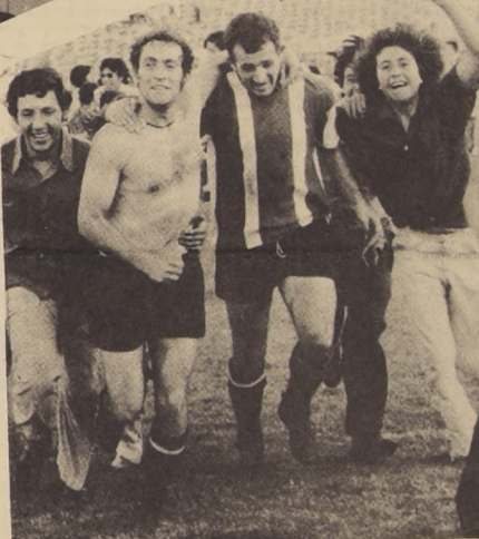
LA VUELTA OLÍMPICA. Los torses desnudos, el rostro feliz y los hinchas alrededor exteriorizan su alegría.