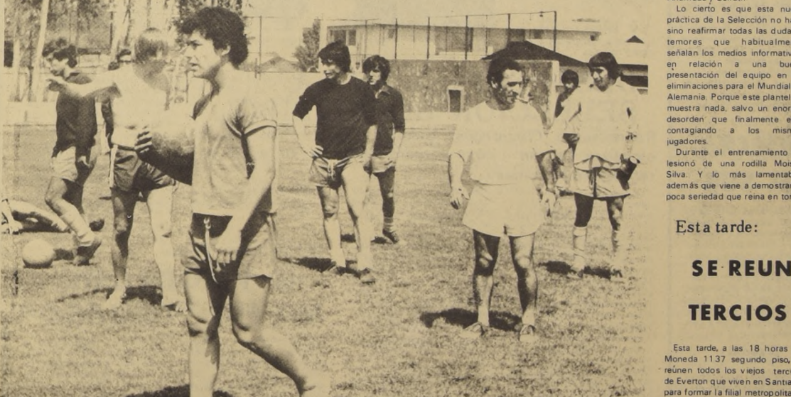
NUEVAMENTE ENTRENO la Selección. Esta vez enfrentó a Colo Colo. Mucho desorden en Juan Pinto Durán. Cada vez más dudosos a la clasificación.

En medio del desorden de siempre volvió a entrenar ayer la Selección Nacional, bajo la dirección del alemán Rudi Gutendorf. En esta ocasión el rival del equipo seleccionado fue el campeón de la temporada pasada, Colo Colo.