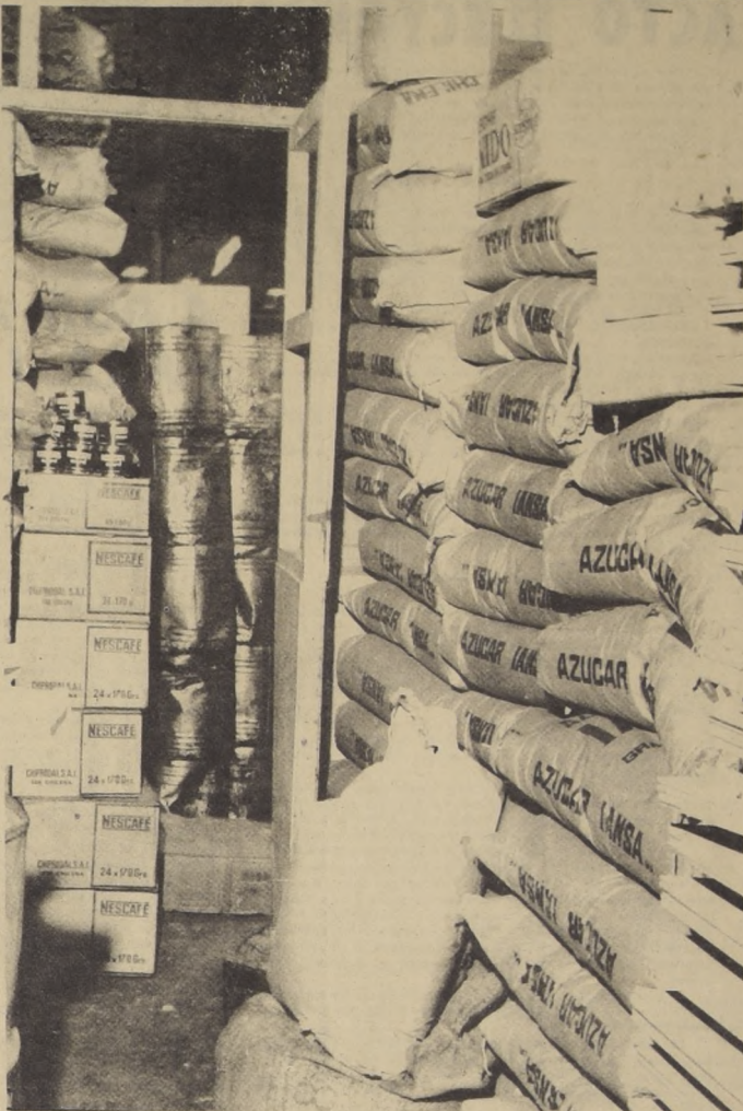
MAS DE MEDIO CENTENAR de bodegas como estas han sido descubiertas gracias a la vigilancia del pueblo organizado, que sabe dónde están los alimentos que ellos necesitan. La derecha insiste en su campaña de hambrear al pueblo, para con ello sacar sus jugosos dividendos electoreros.

ción impulsando el mercado negro y el acaparamiento. Los mismos trabajadores que en el patronal de octubre supieron echar por tierra las maniobras de la derecha para provocar el caos económico, darán el lunes 5 una nueva demostración de su conciencia de clase. Al grito de la "Izquierda unida jamás será vencida" las fuerzas de posiciones revolucionarias se han hecho presente en manifestaciones públicas. El lunes próximo lanzando el mismo grito, el pueblo reafirmará su compromiso de lucha por la Patria con más fuerza que nunca por conquistar todo el poder para la clase obrera, para asegurar el desarrollo económico y afianzar la independencia y la liberación de Chile.