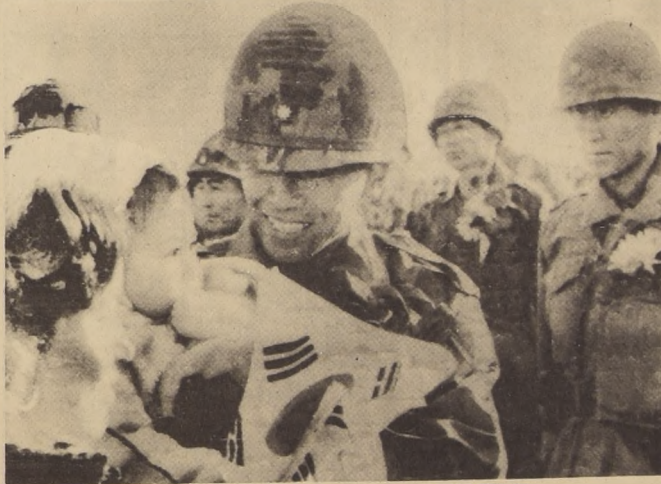
SUNAN, Corea del Sur. Soldados coreanos que participan en el conflicto bélico de Vietnam, son recibidos por sus autóctonos parientes al regresar a esta localidad.

Los Gobernadores de los Estados más dañados no han podido establecer aun un balance completo de pérdidas materiales que, provisionalmente, estiman cuantiosas. Desde los primeros momentos, autoridades, Cruz Roja y Servicios de Asistencia prestaron inmediata ayuda a los damnificados. En la capital mexicana, fuera del pánico y nerviosismo correspondiente, durante los 3 minutos que duró el fenómeno, no se registraron víctimas ni daños de importancia. Hubo averías en una tercera parte del sistema eléctrico y gigantesco embolamientos al no funcionar los semáforos.