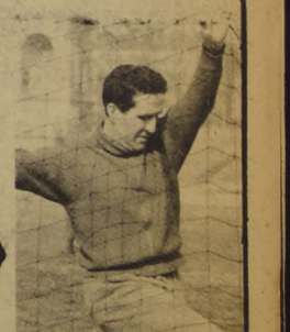
HELENIO HERRERA: prendió la "chispa" contra los árbitros.