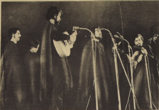
El Conjunto Quilapayún, que tendrá destacada actuación en el XIV Festival de la Canción de Viña del Mar, que se inicia mañana viernes con la etapa folklórica.

El Conjunto Quilapayún, uno de los más conocidos de nuestro país, se encuentra programado como otra de las grandes atracciones, además del Grupo Ceniza; Tony Roland, el holandés Euson, el español Julio Iglesias y otros.