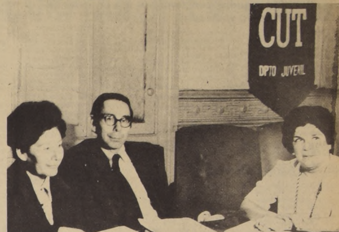
Carlos Altamirano a funcionarias de la Administración Pública "el mayor acto individual es dar vida a un nuevo ser, el mayor acto social es hacer la revolución". En el grabado junto a las candidatas a diputada por el Primer Distrito, Carmen Lazo y Fidelma Allende.

"Con la misma alegría con que la madre ve crecer a un hijo sin importarle los sacrificios que ello implique, ustedes tendrán la satisfacción de comprobar que han sido promotoras de una nueva sociedad, de un Chile más feliz", finalizó diciendo Carlos Altamirano.