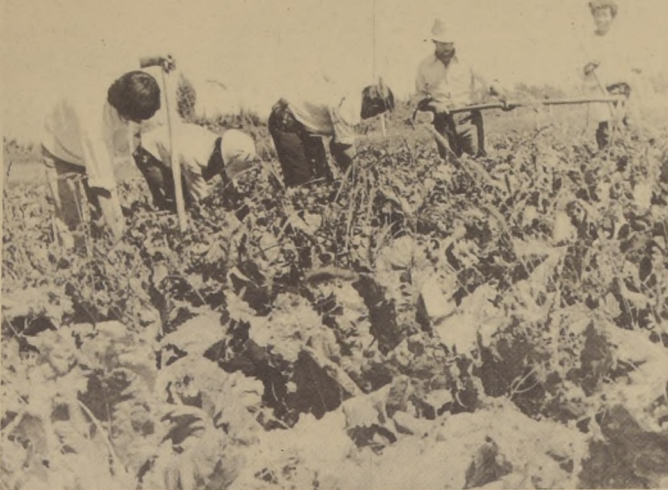
NUEVAS hectáreas incorporadas corresponden al plan de cultivo aprobado por los propios campesinos conjuntamente con los servicios del agro.