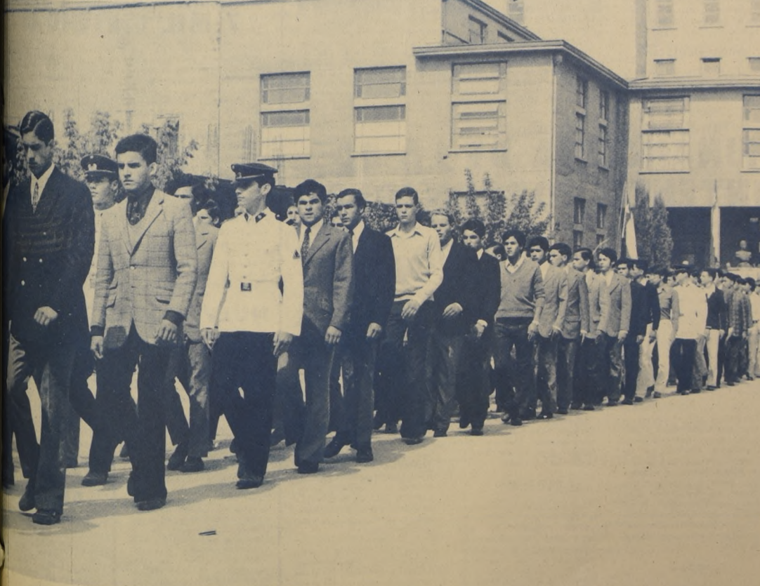
SUS PRIMEROS pasos y giros militares dieron ayer los nuevos cadetes que ingresaron a la Escuela Militar "Bernardo O'Higgins". 250 jóvenes que eligieron la carrera de las armas inician una etapa diferente en sus vidas. Quedará atrás el cariño de la madre o la protección del padre, que será reemplazado por el consejo de un instructor o el apoyo de un compañero. Luego el uniforme del Ejército los llenará de orgullo al sentirse parte de esta Patria a la que han jurado defender.

A la hora de las comparaciones entre el pasado inmediato y el (Pasa a la página 4)