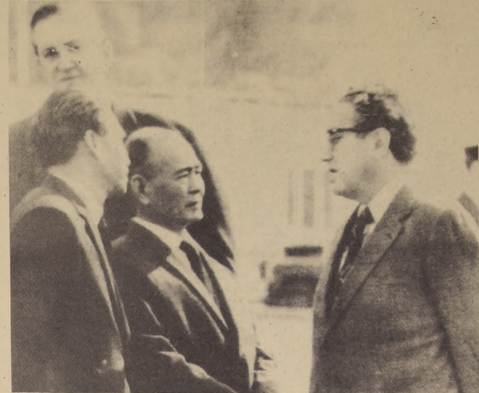
HONG KONG. El Enviado Especial del Presidente Nixon, Henry Kissinger, que viajó a Peking para entrevistarse con los líderes chinos, aparece en el aeropuerto de esta ciudad al embarcarse rumbo a la capital china.