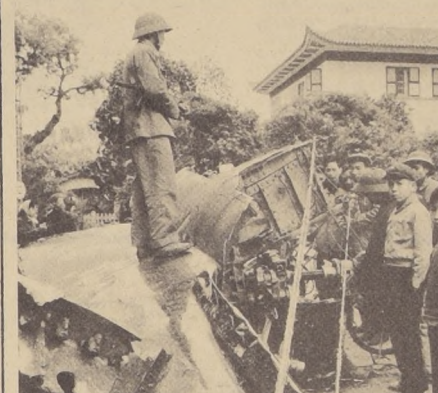
HANOI. Habitantes de esta ciudad observan los restos de un bombardero norteamericano "B-52", derribado por el fuego antiaéreo de las Fuerzas de Liberación vietnamitas.