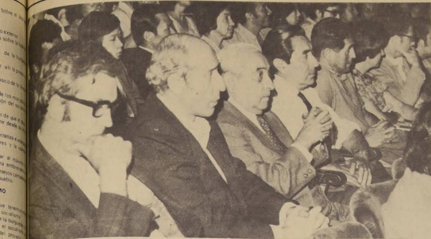
Representantes de todas las colectividades y movimientos políticos de la izquierda presidieron el homenaje a las fuerzas progresistas.

... rindieron al sacerdote guerrillero Camilo Torres Restrepo, con motivo de cumplirse el séptimo aniversario de su asesinato.