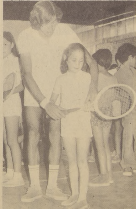
"LA ESPERANZA está en el desarrollo del tenis popular, en cada comuna", afirma el ganador de Llo Lleo.

Encabeza la tabla de posiciones, Arica con 8 puntos. Le siguen Iquique, con 6. Santa Cruz con 5. Valdivia y Cisterna con 4. Vallenar y Valparaíso con 2 y cierra las posiciones, Angol con solamente 1 punto.