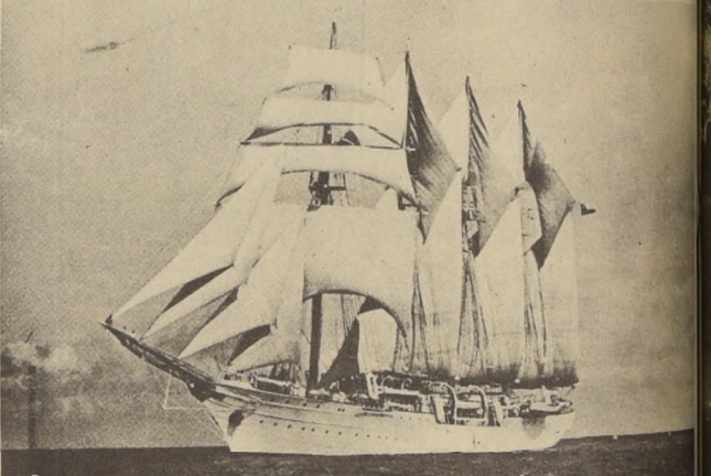
El buque escuela ESMERALDA, cuyo viaje ha sufrido un retraso en el itinerario, debido al mal tiempo que lo sorprendió en el mar Caribe al zarpar de Venezuela. Su próximo arribo es al puerto El Ferrol, en España, anunciado para el próximo.

Se incorporarán a los Cursos los Profesores seleccionados que cuenten con la autorización oficial de sus respectivas Direcciones de Educación o de las Instituciones pertinentes. 10. Internado y Alimentación Los Profesores de provincia que sean seleccionados dispondrán de internado y alimentación durante el periodo que duren los Cursos. A los Profesores de Santiago solo se les proporcionará almuerzo II. REQUISITOS MINIMOS EXIGIDOS Para el Curso A: 1. Estar en posesión de un título Docente 2. Tener experiencia docente y/o administrativa no menor de cinco años 3. Ser docente o funcionario en servicio activo, preferentemente con responsabilidad en administración o planeamiento educacional 4. Garantizar una dedicación exclusiva al Curso