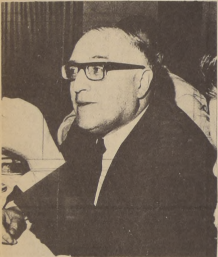
ORLANDO MILLAS, Ministro de Economía. "La acción de la comunidad organizada permitirá rebajar en forma considerable el proceso inflacionario".

ESTOS SON algunos de los pobladores estafados en San Bernardo. Cansados de esperar la entrega del televisor, decidieron denunciar al comerciante, que al final resultó ser un pillo de siete suelas.