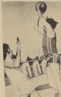
El básquetbol tuvo espectadores al ser instalado en la entrada del estadio, pero los otros deportes, excepto el fútbol, muy pocos...

BALANCE PROVISORIO ¿Qué balance haría Ud. de los deportes que los trabajadores presentaron en estos Juegos? Promisorio en líneas generales, que anuncia ya cuál será la