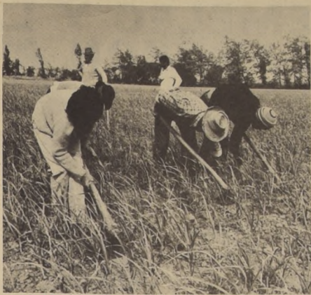
LOS CAMPESINOS no solo están preocupados de aumentar la producción, sino también por solidificar la clase, de que se despache en forma urgente el proyecto de anticipo de reajuste del Ejecutivo. Las organizaciones que agrupan a los trabajadores del campo anuncian varias reuniones para tratar este problema en el curso de esta semana.