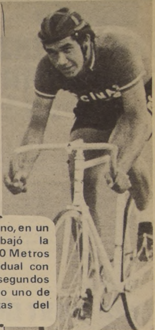
EL CAMPEÓN INICIA su carrera hacia el record

El excelente pedaleo curicano, en un sensacional cometido, rebajó la marca nacional para los 4.000 Metros Persecución Olímpica Individual con un registro de 5 minutos 9 segundos 3 décimas, que lo ubica como uno de los mejores especialistas del continente.