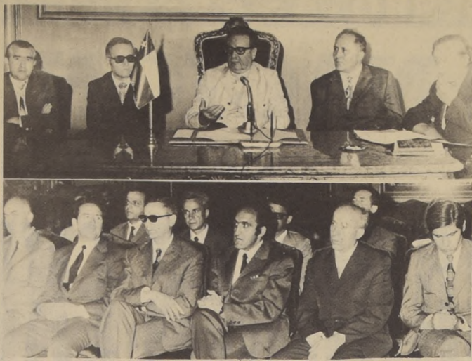
El Presidente Allende recibió en el Salón Toesca a una misión búlgara integrada por profesionales de ese país. Acompañaba la delegación, David Baytelman.

La Dirección General del S.S. por intermedio de su Oficina de Racionalización, que dirige Homero López, junto con enviar la Circular Interna N°231 a todos los Departamentos, Zonales y Agencias Locales, dando a conocer esta Resolución, informó a la prensa que no tienen derecho si a este beneficio las pensiones indicadas cuya fecha inicial sea posterior al 1º de Enero de 1972, que la pensión de orfandad del hijo haya cesado en cualquier mes posterior a Enero de 1972 y que el monto de la pensión haya sido mayor que E$450 y menor que E$540 entre Enero Septiembre de 1972, y mayor que E$90 y menor que E$140 a contar de Octubre de 1972.