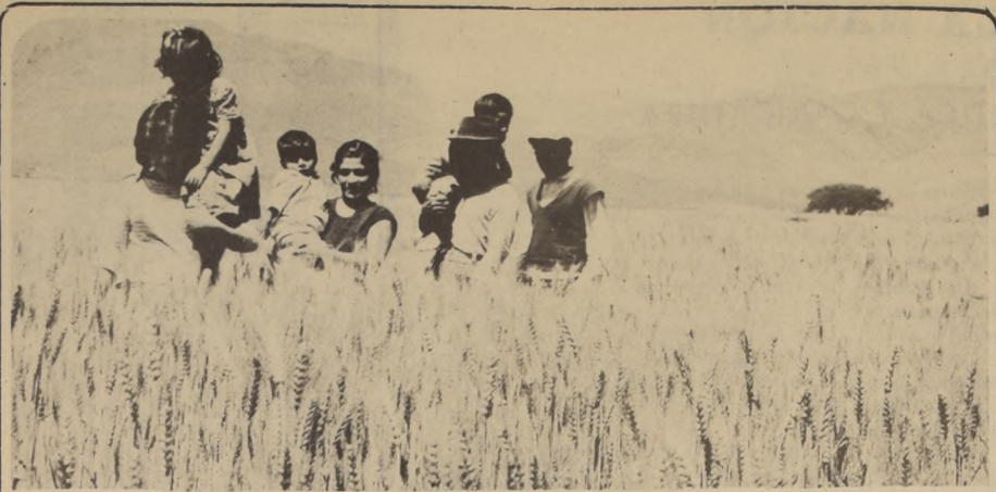
TENDREMOS un millón y medio de toneladas de trigo, y nos quedan 150 mil toneladas de reserva para 1974. Con ello aseguramos el consumo para este año, 1974.

A la inversa, cuando los bancos están en manos del Estado, ellos no cobran tan caro por el dinero que prestan a la actividad económica. Cobran apenas para financiar el costo de sus propias operaciones, pero sin aspirar a ganancias. De modo que los artículos que compran los consumidores, llevan incluido en su costo, un monto mucho menor por el servicio bancario, ya no incluyen la ganancia del banquero. Así el banco no tiene por finalidad ganar dinero, sino prestar un servicio a toda la comunidad, para que los productos que ella compra no se encarezcan demasiado. De modo que si un trabajador engrasado cree que los bancos deberían ganar dinero, en manos del Estado, lo que está aceptando es que le recarguen aún más el precio de las cosas que compra cada día. Cuando los trabajadores vean un balance con cero pesos de ganancia en un banco deben alegrarse de que ningún banquero explotador esté viviendo del encarecimiento de los precios. Cuando los bancos no ganan, los trabajadores ganan.