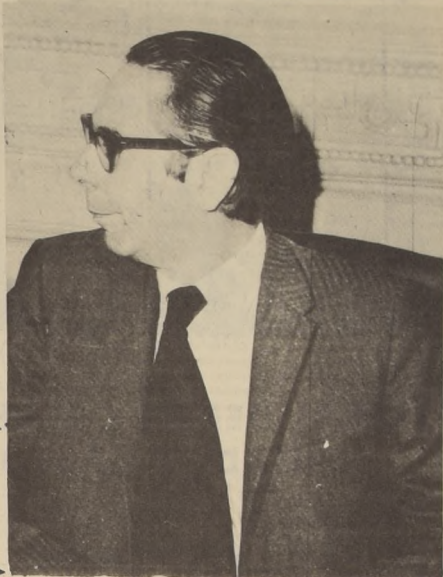
SENADOR CARLOS ALTAMIRANO: El Secretario General del Partido Comunista de Rumania le envió un comunicado en que felicita a su colectividad y a los trabajadores chilenos por el triunfo de la UP en las elecciones parlamentarias.

"Expreso mi convicción de que las relaciones de colaboración amistosa existentes entre nuestros partidos se desarrollarán con éxito en provecho del fortalecimiento de la amistad entre nuestros pueblos y países para el bien de la causa de la paz de la democracia y del socialismo."