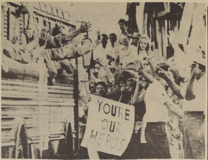
BASE CLARK, Filipinas. Gran recibimiento ante la llegada de un contingente de soldados que fueron liberados en Vietnam del Norte para regresar a Estados Unidos desde Hanoi, en cumplimiento del Tratado de Cese del Fuego.