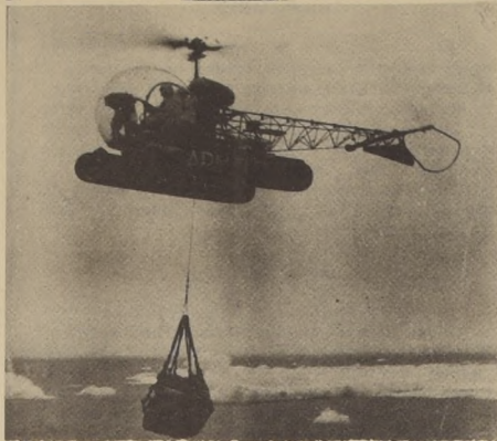
Sus cincuenta años cumple mañana la Aviación Naval de nuestro país y el acontecimiento será celebrado en la Base Aeronaval del Belloto, con una emisión especial de estampillas y la presencia del Ministro de Defensa José Tóhá y el comandante en Jefe de la Armada, Almirante Raul Cornejo

VALPARAISO Corresponsalía del Diario "La Nación" Condell 1281 Teléfono 50778