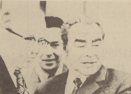
MOSCU. El Secretario General del Partido Comunista soviético, Leonidas Brezhnev, indica su asiento al Secretario del Tesoro de Estados Unidos, George Schultz, momentos antes de iniciarse las consultas sobre las relaciones económicas entre ambos países. La Agencia Tass informó que Brezhnev subrayó la necesidad de que las relaciones norteamericano-soviéticas se edifique en base a los principios de plena igualdad y ventaja recíproca.

La IFALPA condenó el hecho de haber sido abatido un avión de línea libio el mes pasado por parte de aparatos de caza israelíes.